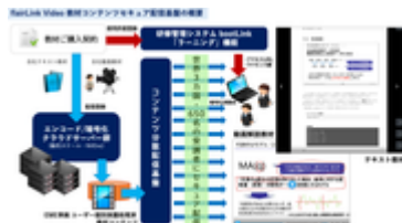
flairLink video 教材コンテンツセキュア 配信基盤の概要